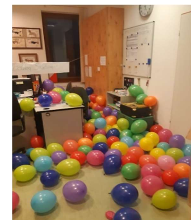
Dekorátor és fotó: Tóbiás Attiláné (Kapitány Mónika)

Novemberben is történni fog valami. Ecetfalvy Jónás két szünet között maga lesz a hallgatás. Az ember mindig arra vágyik, hogy örökké két dolog között legyen. A szünet kezdetét jelző csengő és a szünet végét jelző csengő között például, de a szünet végét jelző csengő lehetőleg ne szólaljon meg. November október és december között fog megtörténni. Az élet az élet kezdete és az élet vége között történik. Ennek a szövegnek a története az első nagybétútól az utolsó mondatzáró írásjelig tart. Az év napokból áll. Minden nap reggeltől estig tart. Este minden nap véget ér, estig pedig mindig ki lehet bírni valahogy. Sokat segít az öröm, a vidámság, a boldogság. Mosoly. Kettőspont, zárójel bezárva.