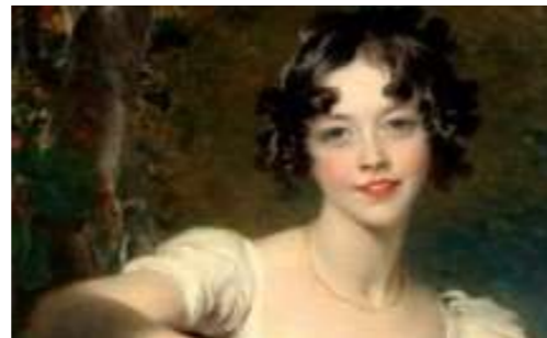
Képek forrása: https://eduline.hu/kozoktatasi/20101202_ragogumi_tanulas_nemet_iskola https://www.lira.hu/hu/ekonyv/szorakoztato-irodalom-1/romantikus/napsugar-kis-asszony-ekonyv-epub-mobi